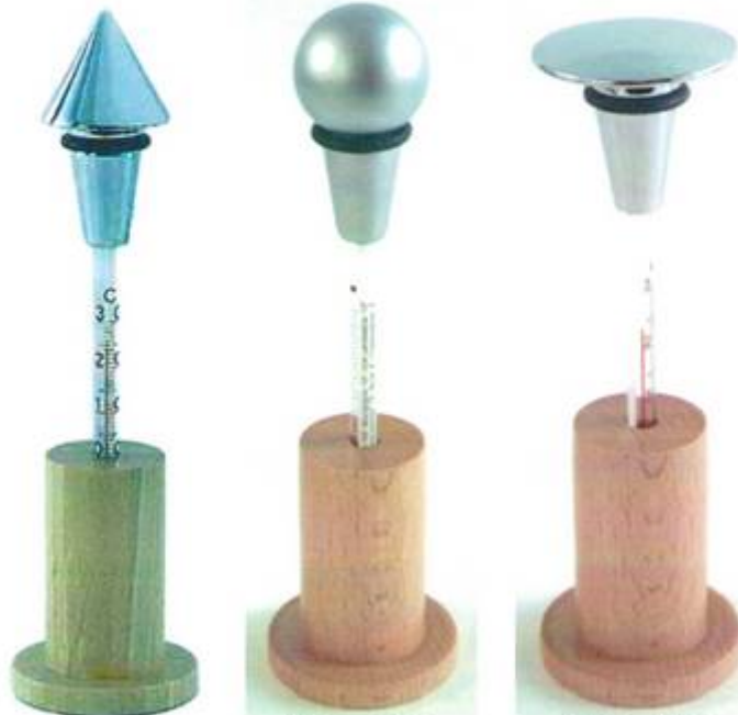
Kegel · cone

Während des Verzehrs lässt sich mit ihm die Flasche abdichten.